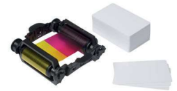
Pack de consommables pour 100 impressions (ruban couleur et cartes)