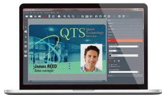
Logiciel de personnalisation de cartes Evolis Badge Studio®+ (incluant l'importation depuis les bases de données)