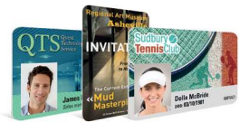
Cartothèque en ligne